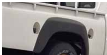
خزان وقود إضافي Sub-Fuel Tank

Top-of-the-class wheel stroke makes easy work of rough roads and unexpected obstacles.