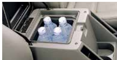
صندوق تبريد (اختياري) Cooler box (Optional)