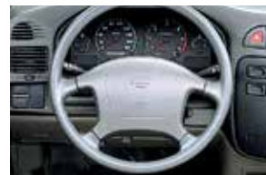
تحكم بقيادته بفضل العدادات الواضحة القراءة والفتايح الواقعة في متناول اليد.

Take command with read-at-a-glance gauges and right-at-hand controls.