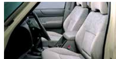
تلمس الفارق الذي تمنحك إياه المقصورة الرحبة، وخاصة في الرحلات الطويلة.

Take command with read-at-a-glance gauges and right-at-hand controls.