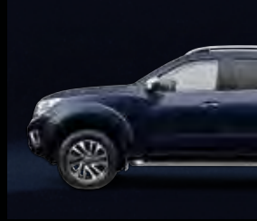
أزرق داكن Dark Blue P (BW9)