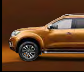
أرجواني Orange PM (EAU)