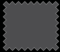
W (رمادي) W (Grey)

تحتفظ شركة نيسان موتور بحقها في إجراء أية تعديلات بدون إشعار وذلك فيما يتعلق بالألوان والمعدات والتجهيزات أو المواصفات الموضحة في هذا الكتيب أو في إغاف إنتاج طرازات محددة. قد تختلف ألوان السيارات الحقيقية قليلاً عن الألوان المبينة في هذا الكتيب. تختلف المواصفات من بلد لآخر طبقاً لظروف السوق المحلي. الرجاء مراجعة الموزع أو الوكيل المحلي لكي تضمن أن السيارة للسلمة تتوافق مع احتياجاتك ومتطلباتك وتوقعاتك.