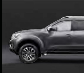
رمادي Grey M (K51)