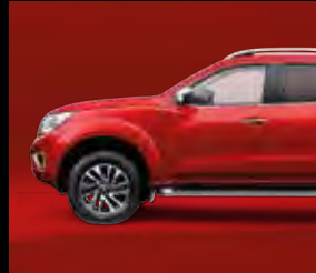
أحمر زاه Red Brisk (Z10)