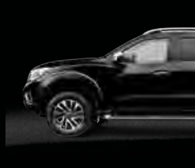
أسود Black M (GNO)