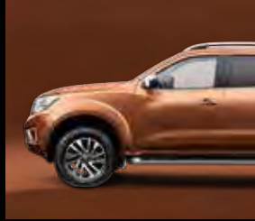
بني داكن Dark Brown PM (CAQ)