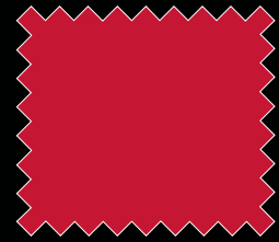
A (أحمر) A (Red)