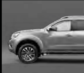
فضي Silver M (KLO)