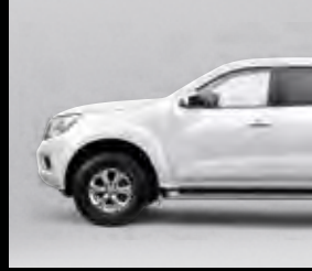
أبيض White (QM1)