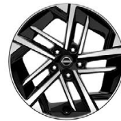
17" АЛУМИНИЕВИ ДЖАНТИ