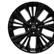
19" АЛУМИНИЕВИ ДЖАНТИ