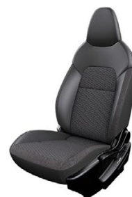
ТЕКСТИЛ И СИНТЕТИЧНА КОЖА