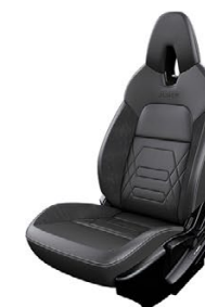
СИНТЕТИЧНА КОЖА И АЛКАНТАРА