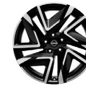
19" АЛУМИНИЕВИ ДЖАНТИ