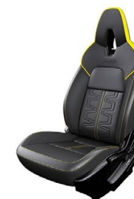
СИНТЕТИЧНА КОЖА И АЛКАНТАРА