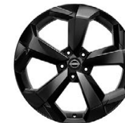
19" АЛУМИНИЕВИ ДЖАНТИ