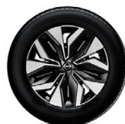
17" СТОМАНЕНИ ДЖАНТИ С ДЕКОРАТИВНИ ТАСОВЕ