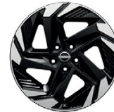
18" АЛУМИНИЕВИ ДЖАНТИ