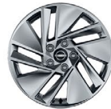
17" АЛУМИНИЕВИ ДЖАНТИ