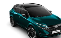
DEEP OCEAN С ЧЕРЕН ПОКРИВ (YBJ)