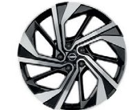
20" АЛУМИНИЕВИ ДЖАНТИ