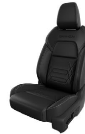
ЧЕРНА КАПИТОНИРАНА КОЖА С ОБШИВКИ ОТ ALCANTARA® И РЕЛЕФНО ЛОГО „QASHQAI“