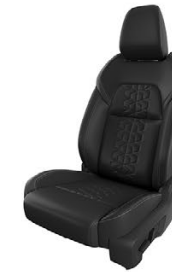
ЧЕРНА КАПИТОНИРАНА СИНТЕТИЧНА КОЖА TEKNA