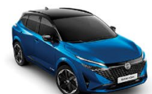
СИН С ЧЕРЕН ПОКРИВ (XGZ)