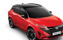
ЧЕРВЕН FUJI С ЧЕРЕН ПОКРИВ (YAU)