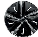
19" АЛУМИНИЕВИ ДЖАНТИ