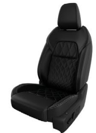
ЧЕРНА ЕСТЕСТВЕНА КОЖА