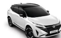
БЯЛ С ЧЕРЕН ПОКРИВ (XKJ)