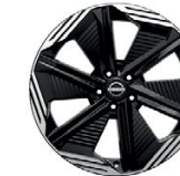
20" АЛУМИНИЕВИ ДЖАНТИ