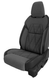
МЕЛАНЖ СИВ ТЕКСТИЛ С ВЛОЖКИ ОТ СИНТЕТИЧНА КОЖА