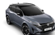
СИВ С ЧЕРЕН ПОКРИВ (XEX)