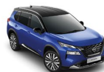
СИН С ЧЕРЕН ПОКРИВ (XEU)