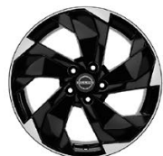
18" АЛУМИНИЕВИ ДЖАНТИ - НИВО АСЕНТА