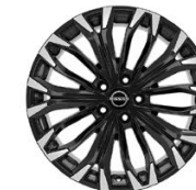
19" АЛУМИНИЕВИ ДЖАНТИ - НИВО N-CONNECTA И ТЕКНА PLUS