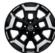
18" АЛУМИНИЕВИ ДЖАНТИ - НИВО N-TREK