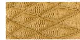
ЕСТЕСТВЕНА КОЖА, БЕЖОВА (C) - ТЕКНА PLUS (Не се предлага за версии с двигател 1,5DDT CVT (163 к.с.))