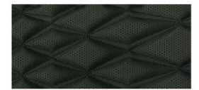
ЕСТЕСТВЕНА КОЖА, ЧЕРНА (G) - ТЕКНА PLUS