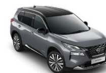
КЕРАМИЧНО СИВ С ЧЕРЕН ПОКРИВ (XEX)