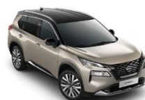
ЗЛАТИСТ С ЧЕРЕН ПОКРИВ (XEW)