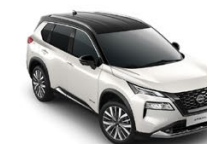
БЯЛ С ЧЕРЕН ПОКРИВ (XKJ)

Доплащане за двуцветна комбинация: 1 270,00 € / 2 483,90 лв. с ДДС.