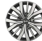
20" АЛУМИНИЕВИ ДЖАНТИ - ОПЦИЯ ЗА НИВО ТЕКНА PLUS