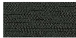
ТЕКСТИЛ ЧЕРЕН/СИВ (G) - АСЕНТА