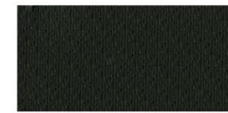
ВОДОНЕПРОМОКАЕМА ТАПИЦЕРИЯ ЧЕРНА (G) - N-TREK