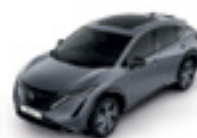
КЕРАМИЧНО СИВ (S) - (KBV)