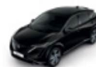
ЧЕРЕН ПЕРЛЕН (M) - (GAT)