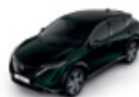
ТЪМНО ЗЕЛЕН (M) - (DAP)