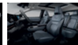
ЕСТЕСТВЕНА КОЖА NARRA, СИНЯ (Z) - ОПЦИЯ ЗА НИВО EVOLVE

Nissan си запазва правото за промяна на цени и спецификации без предварително уведомление.