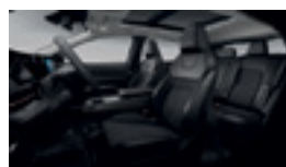
СИНТЕТИЧНА КОЖА И ТЕКСТИЛ, ЧЕРЕН ЦВЯТ (G) - ADVANCE