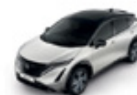
ПЕРЛЕНО БЯЛ С ЧЕРЕН ПОКРИВ (M) - (XGA)

► Доплащане за цвят металик (M): 1,050 лв с ДДС. ► Доплащане за двуцветна комбинация: 2,490 лв с ДДС.