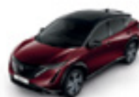
БОРДО МЕТАЛИК С ЧЕРЕН ПОКРИВ (M) - (XGG)