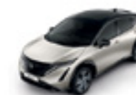
СРЕБЪРЕН С ЧЕРЕН ПОКРИВ (M) - (XGV)