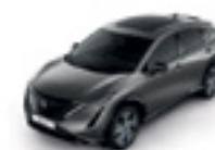
ТЪМНО СИВ (M) - (KAD)