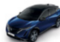
ТЪМНО СИН МЕТАЛИК С ЧЕРЕН ПОКРИВ (M) - (XGU)