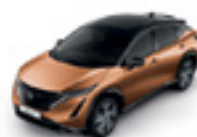
БРОНЗОВ МЕТАЛИК С ЧЕРЕН ПОКРИВ (M) - (XGJ)