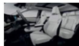
СИНТЕТИЧНА КОЖА И ТЕКСТИЛ, СВЕТЛО СИВ ЦВЯТ (K) - ADVANCE