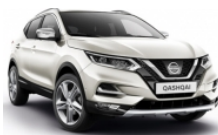
БЯЛ (M) - QAB