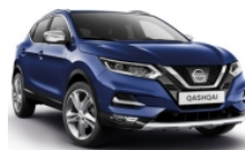
ТЪМНО СИН (M) - RBN