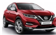
ЧЕРВЕН (M) - NAJ