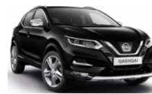
ЧЕРЕН (M) - Z11