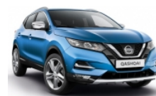
СИН (M) - RCA

► Доплащане за цвят металик (M): 850 лв с ДДС.