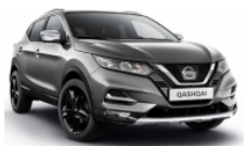
ТЪМНО СИВ (M) - KAD