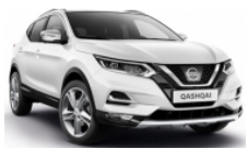
БЯЛ (C) - 326