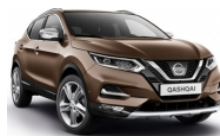
БРОНЗОВ (M) - CAN