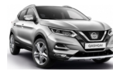
СРЕБЪРЕН (M) - KYO