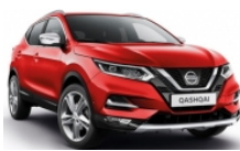
ЧЕРВЕН (C) - Z10