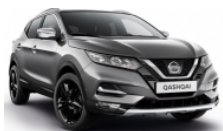
ТЪМНО СИВ (M) - KAD