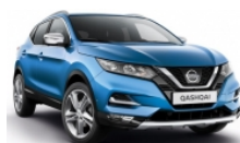
СИН (M) - RCA

► Доплащане за цвят металик (M): 850 лв с ДДС.