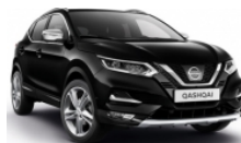
ЧЕРЕН (M) - Z11