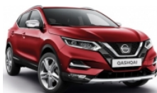
ЧЕРВЕН (M) - NAJ