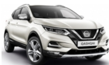
БЯЛ (M) - QAB