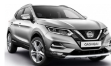
СРЕБЪРЕН (M) - KYO