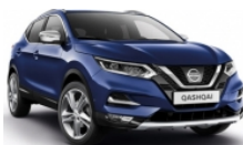
ТЪМНО СИН (M) - RBN