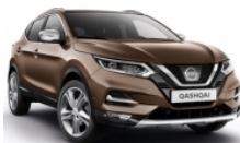
БРОНЗОВ (M) - CAN