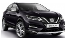
ТЪМНО ЛИЛАВ (M) - GAB