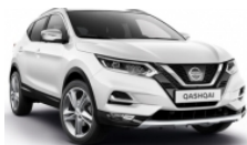
БЯЛ (C) - 326