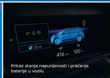
Prikaz stanja napunjenosti i praćenje baterije u vozilu