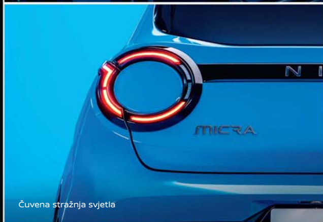
Čuvana stražnja svjetla