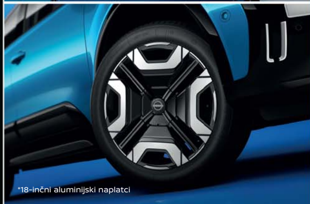
*18-inčni aluminjski naplatci