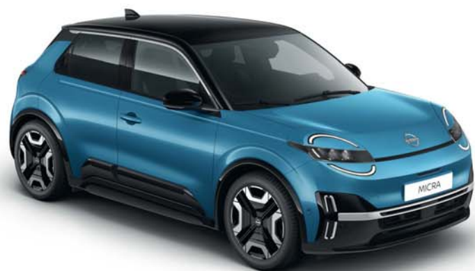
DVOBOJNE KAROSERIJE S CRNIM KROVOM