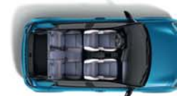
PRTLJAŽNIK OBUJMA DO 326 L