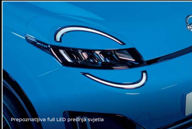
Prepoznatljiva full LED prednja svjetla