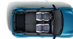
PRTLJAŽNIK OBUJMA DO 1106 L (S PREKLOPLJENOM STRAŽNJOM KLUPOM)