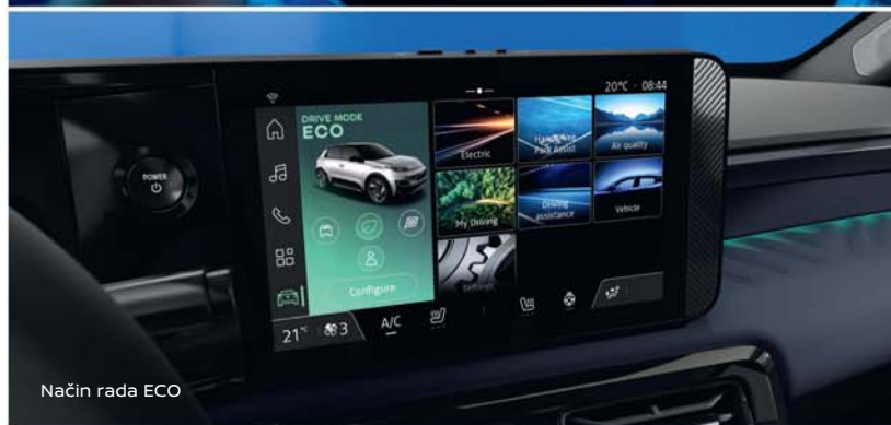
Način rada ECO