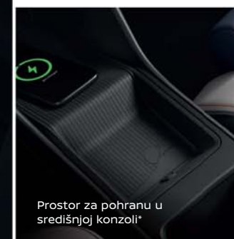
Prostor za pohranu u središnjoj konzoli*