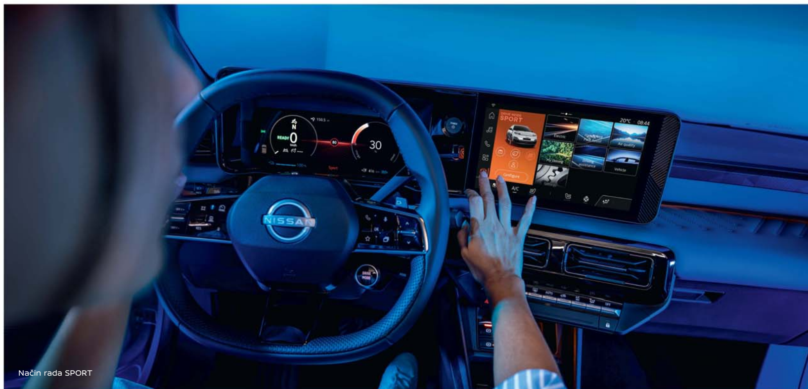
Način rada SPORT

*Značajka je dostupna samo u razini opreme Evolve