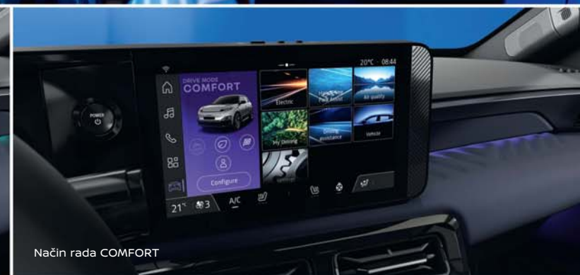
Način rada COMFORT