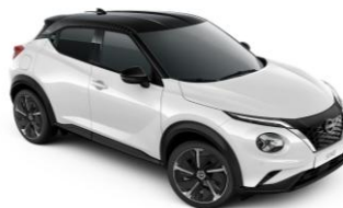
Bílá perleť / Černá (PULSE) XKJ – 0 Kč