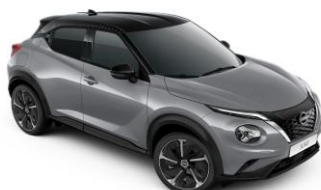
Šedá Ceramic / Černá (PULSE) XEX – 0 Kč