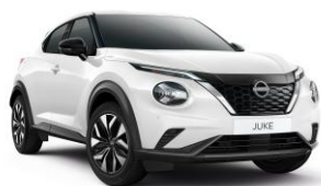
Základní bílá 326 – 0 Kč