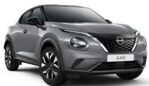
Šedá Ceramic KBY – 19 900 Kč