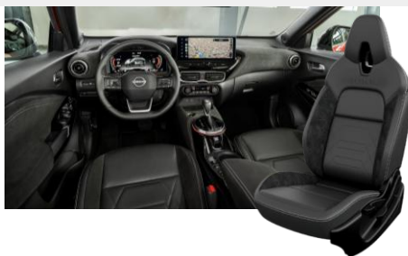
Sedadla ze syntetické kůže/kůže s vložkami Alcantara