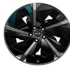
19" kola z lehkých slitin (pouze pro barvu karoserie YBJ)