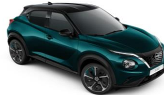
Deep Ocean / Černá (PULSE) YBJ – 0 Kč