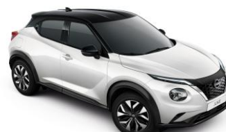
Bílá perleť / Černá XKJ – 28 900 Kč