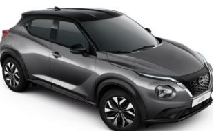
Ocelová / Černá GAQ – 28 900 Kč