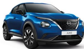
Modrá Magnetic RCF – 19 900 Kč