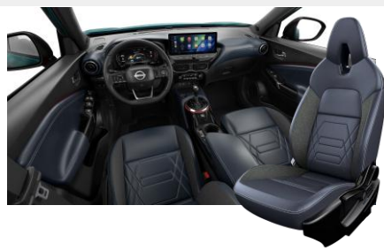
Sedadla ze syntetické kůže s melange vložkami