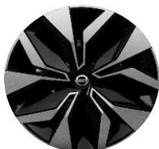
17" kola Flex