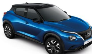
Modrá Magnetic / Černá XGZ – 28 900 Kč