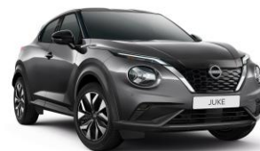
Ocelová KAD – 19 900 Kč