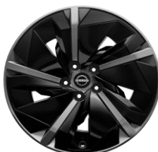
19" kola z lehkých slitin (pouze pro barvy karoserie QBE a KBY)