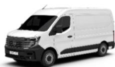
Mineral White (QNG) - solid