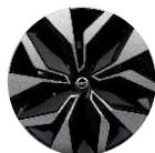
17" terasveljed Sakura