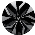
17" terasveljed Sakura