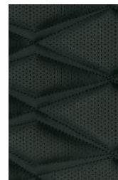
Tekna ja Tekna+ interjööri valik Pruun või Must tepingutega kvaliteetnahk