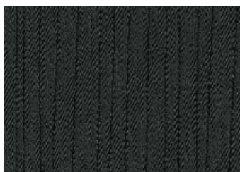
Acenta ja N-Connecta interjööri valik Must tekstiil