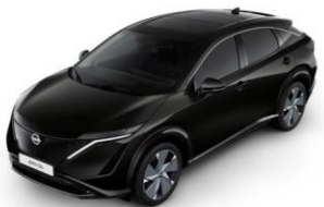
GAT Pearl Black