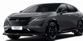
KAD Dark Metal Grey