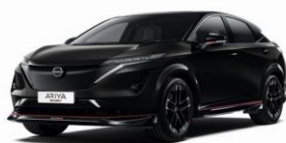
GAT Pearl Black