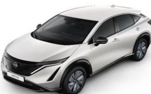
QBE Pearl White