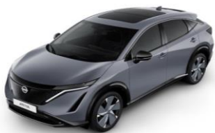
KBY Ceramic Grey