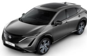
KAD Dark Metal Grey