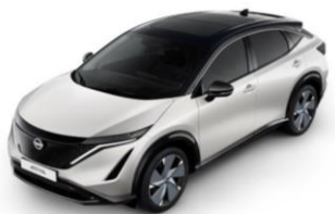
XGA White Pearl / Black