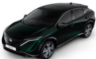
DAP Aurora Green