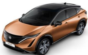
XGJ Akatsuki Copper / Black