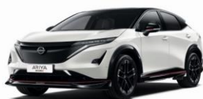
XGA White Pearl / Black