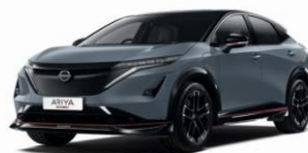
YAZ NISMO Stealth Grey / Black