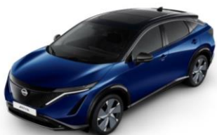
XGU Blue Pearl / Black