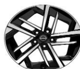
17" легкосплавные диски