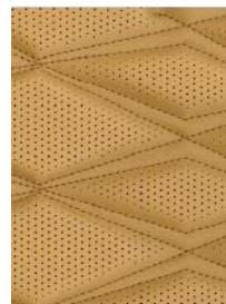
Салон для версии Текна / Текна+ Кожа премиум-класса со стежкой, Black и Tan