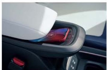
Cargador inalámbrico [3]