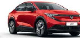
FUJI SUNSET RED - NBV