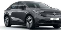
GUN METAL GREY - KAD