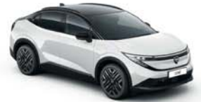
KORI WHITE / BLACK - XKJ