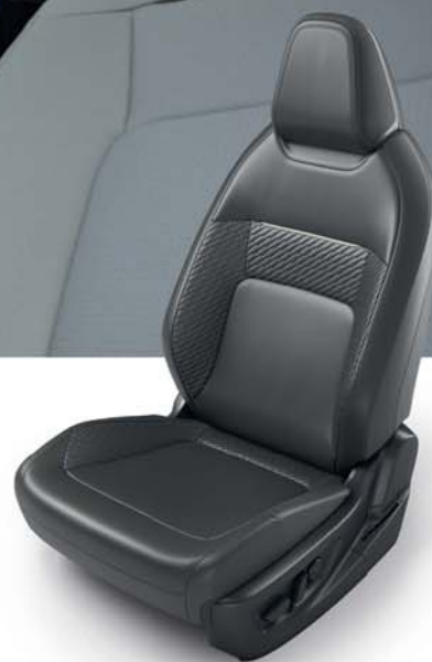
Disponible solo en interior negro