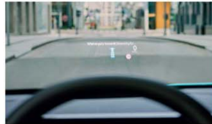
Head-up display [1]