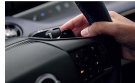
Levas para frenada regenerativa