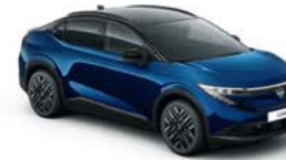
SUKUMO BLUE / BLACK - XHQ