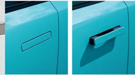
Manecillas de las puertas delanteras enrasadas