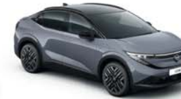
KATANA GREY / BLACK - XEX