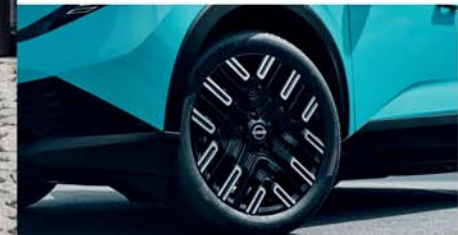
Llantas de aleación de 19" [1]

[1] Función disponible según la versión, de serie o solo como opción (con cargo adicional).