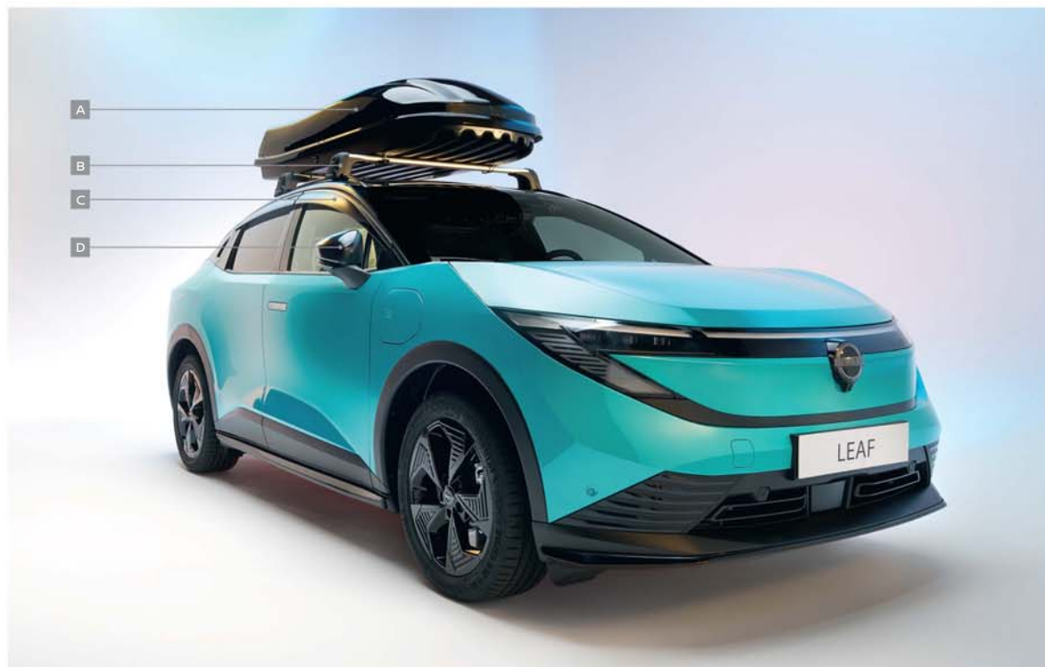
A - Cofre de techo mediano / B - Barras portaequipajes / C - Deflectores de ventanas / D - Embellecedores para los retrovisores