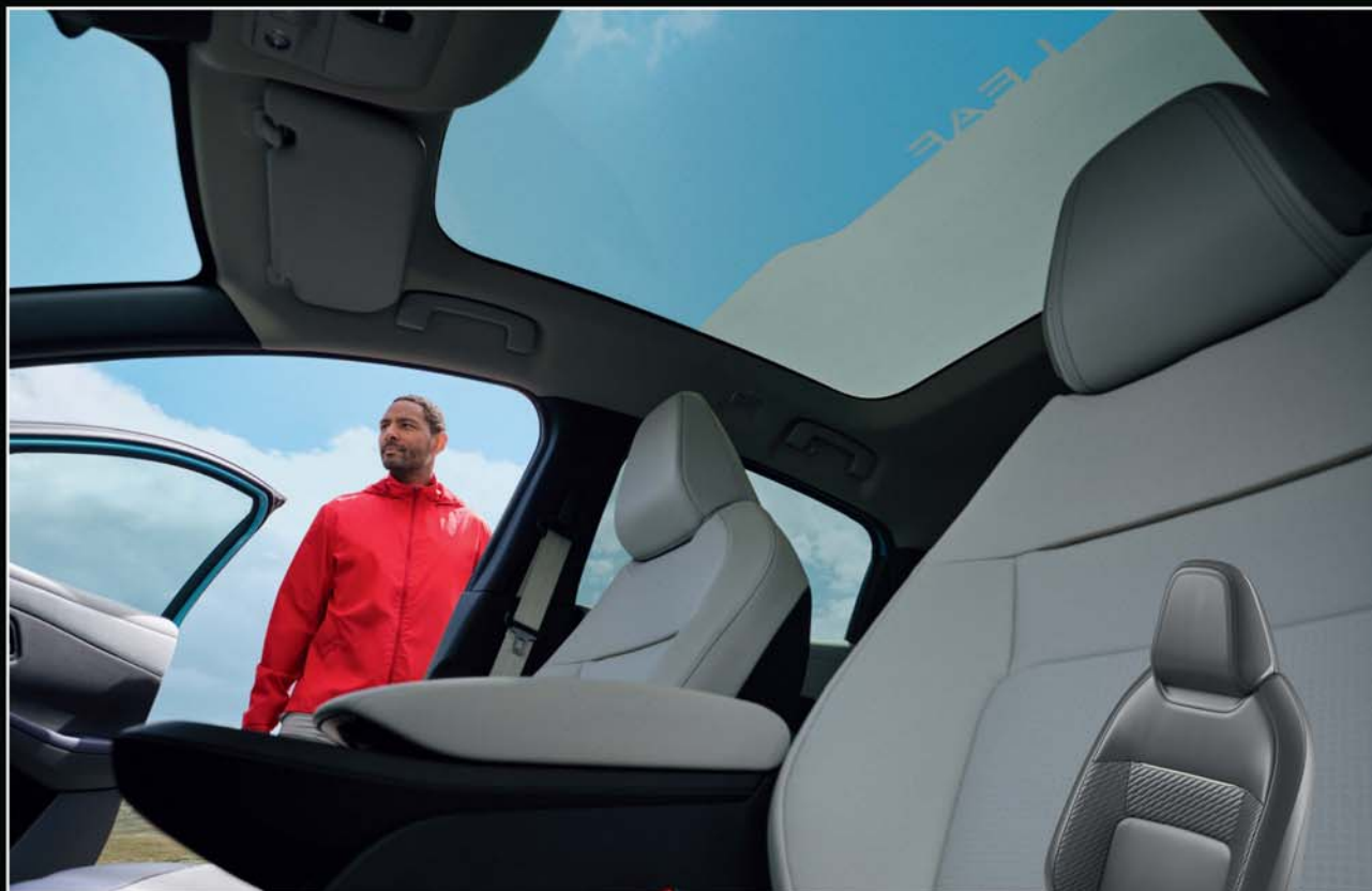
Techo panorámico con oscurecimiento regulable [1]