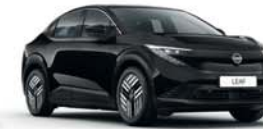
NINJA BLACK - GAT