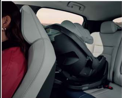
Asientos traseros con 2 anclajes ISOFIX en cada lado