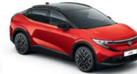
FUJI SUNSET RED / BLACK - YAU