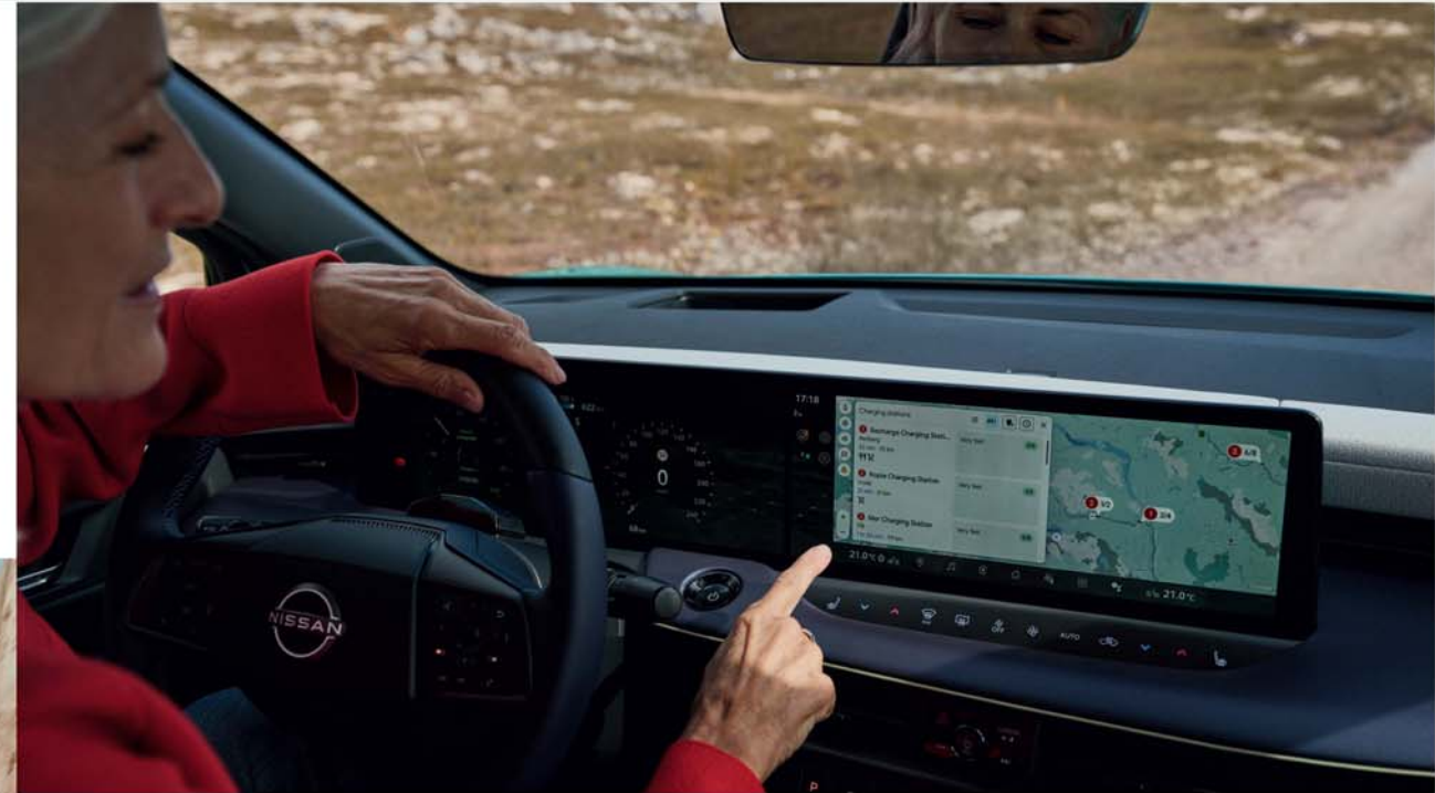
Planificador de rutas integrado de Google Maps

[1] Los valores mostrados corresponden a autonomía combinada WLTP [2] La velocidad y el tiempo de carga dependen de diversas condiciones, como el tipo y estado del cargador, la temperatura de la batería y la temperatura ambiente en el momento de uso. En climas fríos, puede ser necesario el uso del sistema de calefacción de la batería para mejorar específicamente la velocidad de carga rápida. [3] Función disponible en una fecha posterior.