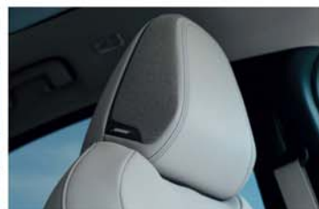
Sistema de sonido Premium BOSE ® [1]