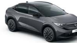
GUN METAL GREY / BLACK - GAQ