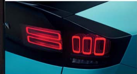
Luces LED traseras con efecto holográfico 3D [1]