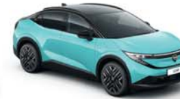
TURQUOISE / BLACK - YBR