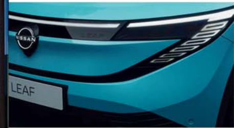
Logo frontal Nissan iluminado [1]