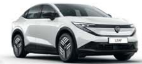
KORI WHITE - QBE