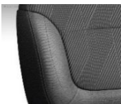
Harmaa tekstiiliverhoilu N03