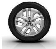
17" kevytmetallivanteet (lisävaruste)