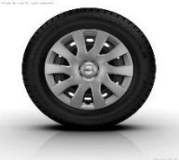
16" teräsvanteet ja täyskapselit