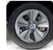
15" ALLOY (EVALIA & VAN)