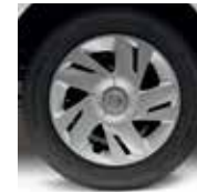
15" STEEL COVER (EVALIA & VAN)