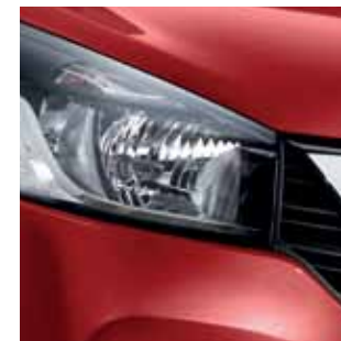
MAGMA RED (S) R70