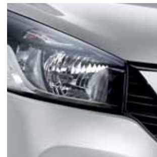
GLACIER WHITE (S) WHI