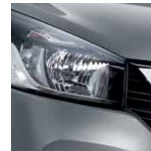
MERCURY GREY (M) GRP