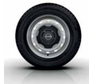
16" STEEL WHEEL