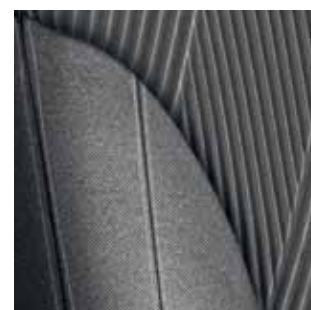
SEAT TRIM JAVA (VAN) BLUE - DARK GREY