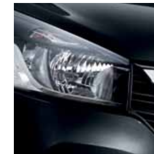
JET BLACK (M) BLK