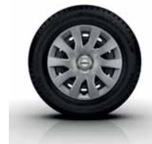
16" WHEEL COVER