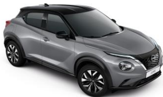
Gyöngyházzsürke/ Fekete XEX – 290 000 Ft