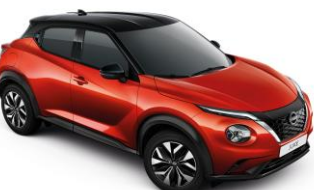
Naplementevörös/ Fekete YAU – 290 000 Ft