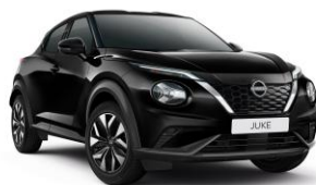
Gyöngyházfekete GAT – 160 000 Ft