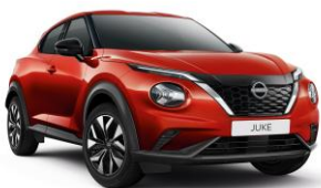
Naplementevörös NBV – 0 Ft