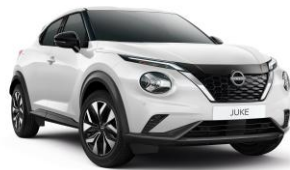
Gyöngyházfehér QBE – 190 000 Ft