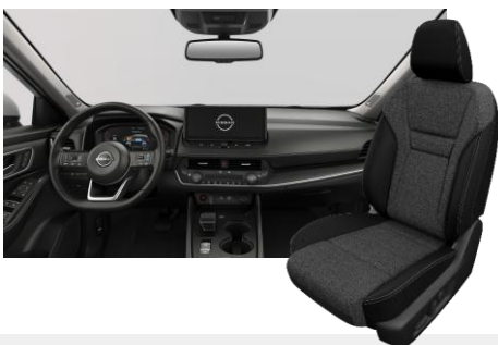
FEKETE SZÖVET ÜLÉSEK [G]