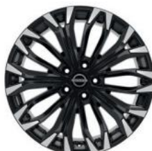
19"-OS KÖNNYŰFÉM KERÉKTÁRCSÁK