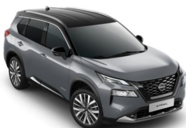
Gyöngyházsürke - Fekete XEX – 420 000 Ft