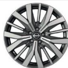
20"-OS KÖNNYŰFÉM KERÉKTÁRCSÁK (Opció)