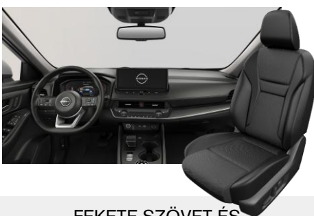
FEKETE SZÖVET ÉS SZINTETIKUS BŐRÜLÉSEK [G]