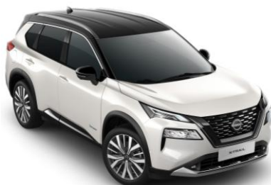
Gyöngyházfehér - Fekete XKJ – 420 000 Ft