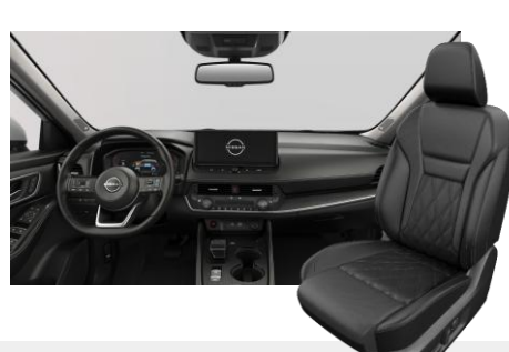
FEKETE NAPPABŐR ÜLÉSEK [G]