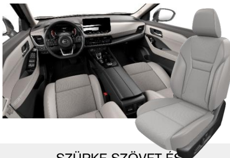
SZÜRKE SZÖVET ÉS SZINTETIKUS BŐRÜLÉSEK [K]