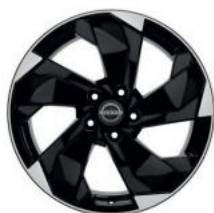
18"-OS KÖNNYŰFÉM KERÉKTÁRCSÁK