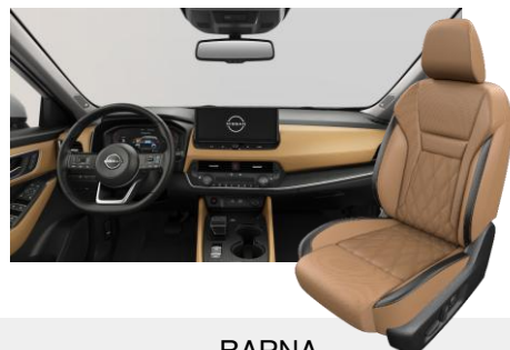
BARNA NAPPABŐR ÜLÉSEK [C]