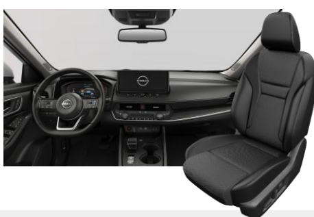
FEKETE SZÖVET ÉS SZINTETIKUS BŐRÜLÉSEK [G]