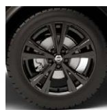
Қара 18" оңай балқытылған дискілер

* Эс Е+ Эн Дизайн, Эс Е Top Эн Дизайн, Ниссан Брейк Ассист, Изофикс, Хэндс-фри, Зиро Грэвити, Би-Лед, Интеллидженд Ки, Ниссан Коннект, Ви Моушен.