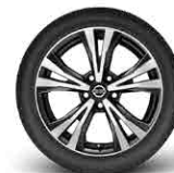
18" легкосплавные диски