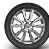
17" легкосплавные диски