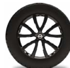
Қара 17" оңай балқытылған дискілер