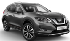
KAD/M — Серый