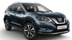
RAQ/M — Синий