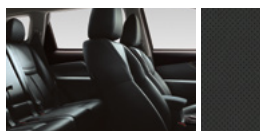
Черная кожа с перфорацией