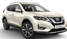
QAB/PM — Белый перламутр