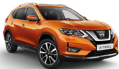
EBB/M — Оранжевый