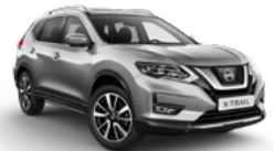
K23/M — Серебристый