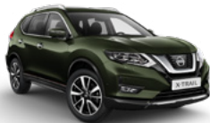
EAN/M — Оливковый