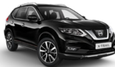
G41/M — Черный