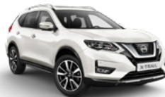
QM1/S — Белый