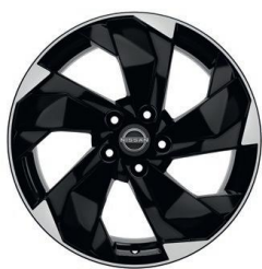
Ratai, skirti „Acenta“ ir „N-Connecta“ versijoms 18" lengvojo lydinio ratlankiai