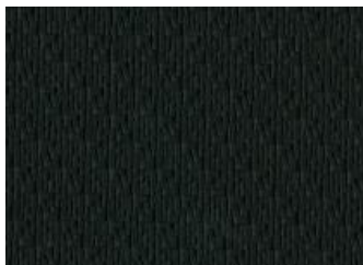
Papildoma „N-Connecta“ versijos įranga PVC oda su „Black“