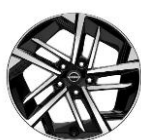
17" легкосплавные диски