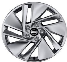
Acenta 17" vieglmetāla diski (215/65 R17)