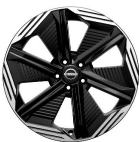
N-Design 20" vieglmetāla diski (235/45 R20)