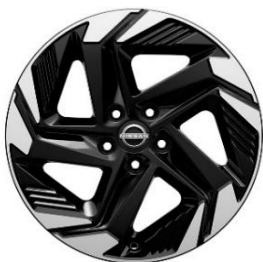
N-Connecta 18" ar dimantu slīpēti vieglmetāla diski (235/55 R18)