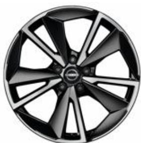
Tekna 19" vieglmetāla diski (235/50 R19)