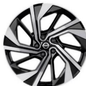
Tekna+ 20" vieglmetāla diski (235/45 R20)