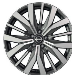
Tekna+ 20" ar dimantu slīpēti vieglmetāla diski