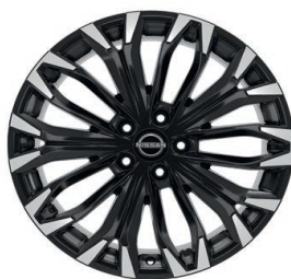
Tekna 19" ar dimantu slīpēti vieglmetāla diski