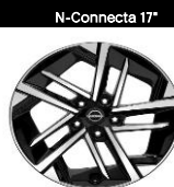
17" легкосплавные диски