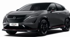
KAD Dark Metal Grey