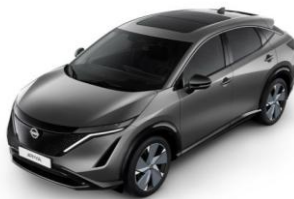
KAD Dark Metal Grey