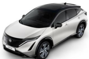
XGA White Pearl / Black