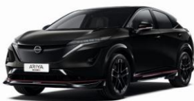
GAT Pearl Black