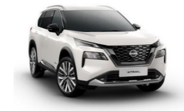
QBE Pearl White