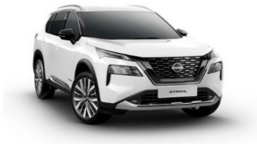
QAK Solid White