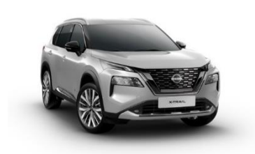
K23 Brilliant Silver