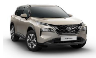
KAY Champagne Silver