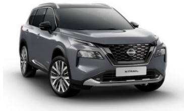
KBY Ceramic Grey