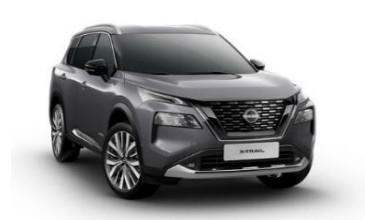
KAD Gun Metallic