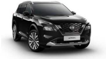
G41 Diamond Black