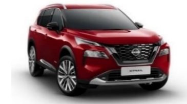
NBL Tinted Red