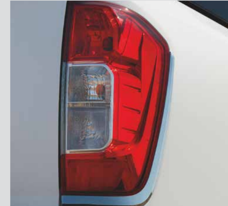
REAR LAMP FINISHER B65514JA0A لمسات من الكروم للمصابيح خلفية أظهر القوة والشجاعة. وأضف الإبداع إلى المصابيح الخلفية. Be brave and bold. Add some style to your rear lights.