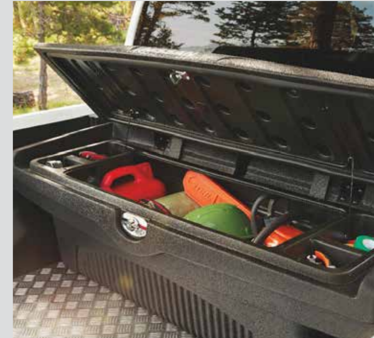
TOOL BOX KE8514K01A صندوق أدوات ينظم الأدوات عند وضعها في صندوق التحميل العريض. Get organized with a fully integrated tool box for wide bed.