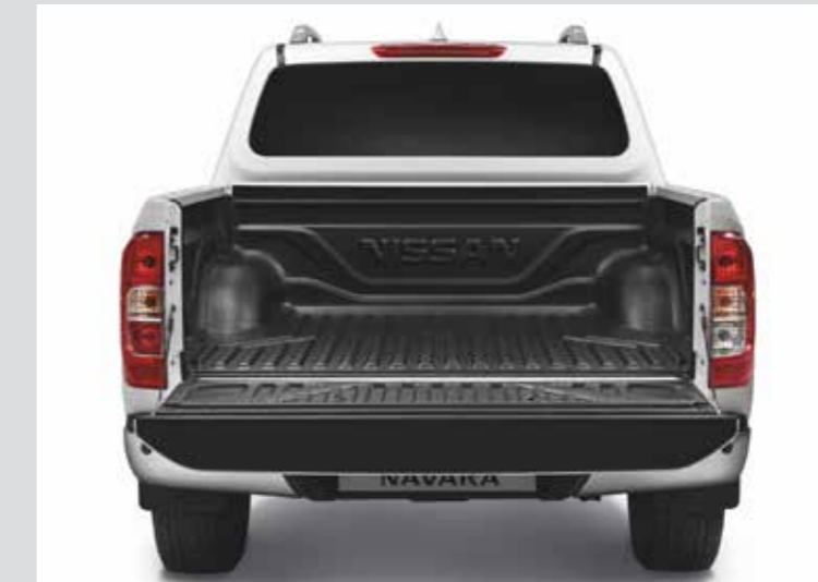
BED LINER KIT KE9314K00B / KE9304K00B KE9314K09A / K35104JA7A غطاء أرضية لصندوق التحميل - طقم كامل الحماية الكاملة لمساحة التحميل في الصندوق الخلفي. متوفرة للصندوق ذي المساحة العريضة أو الضيقة. Keep your bed load space fully protected. Preserve your car and your cargo. Available for wide and narrow bed.