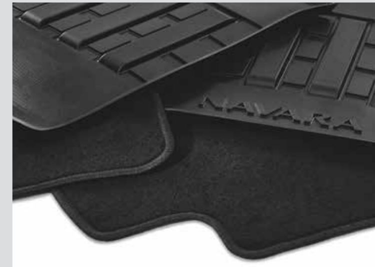
RUBBER FLOOR MATS KE7484K089 مدايسات أرضية مطاطية مدايسات أرضية أصلية تحمي السيارة من الداخل. تشمل خطاطيف التثبيت، سوداء اللون. متكيفة مع جميع فصول السنة. Genuine floor mats to protect the vehicle's interior. (black color). Including fixing hooks. Adapted for all weather.