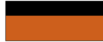
برتقالي نحاسي مع أسود داكن