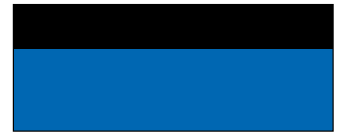
أزرق ساطع وأسود داكن