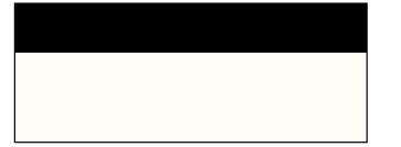
أبيض لؤلؤي مع أسود داكن