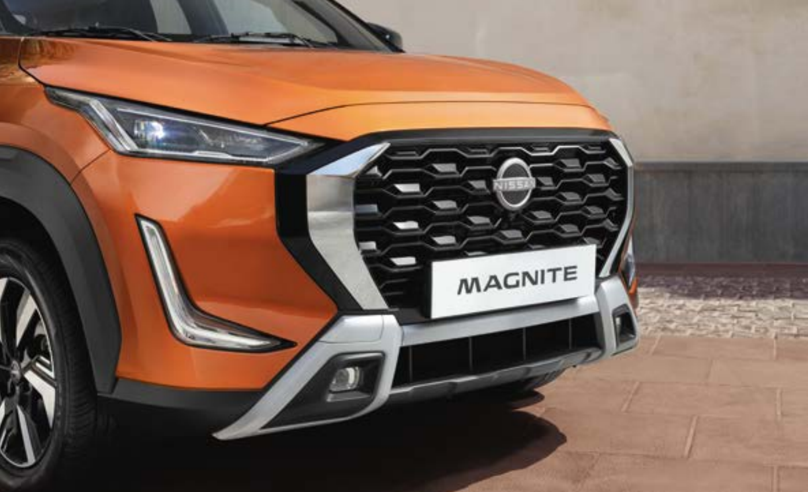
شبكة أمامية جريئة ومميزة، ثنائية اللون، مع صفيحة حماية عائمة