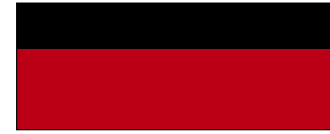
أحمر غارنيت متألق مع أسود داكن