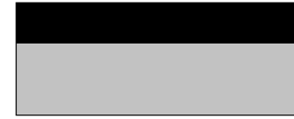
فضي حاد مع أسود داكن