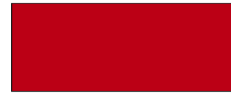
أحمر غارنيت متألق