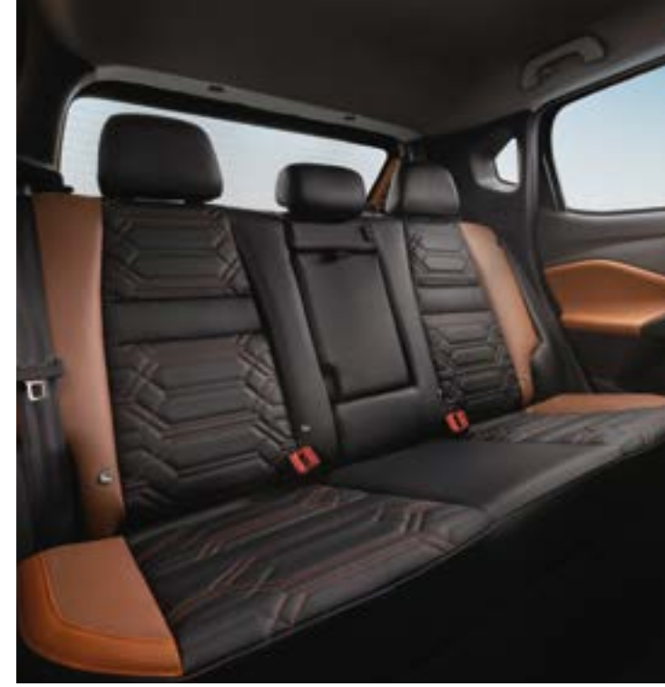
مساحة الركبة في المقعد الخلفي

تضفي لوحة العدادات الجلدية الكاملة الفريدة (لوحة التحكم) وحواف الأبواب لمسمة من الأناقة والرقي على المقصورة الداخلية، ما يزيد من فخامة السيارة وجاذبيتها بشكل عام. بالإضافة إلى أن الخامة ناعمة وفخمة الملمس.