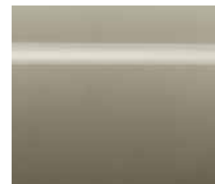
Light Gold (EY0)