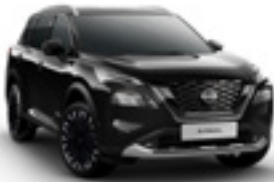
رمادي Diamond Black - G41