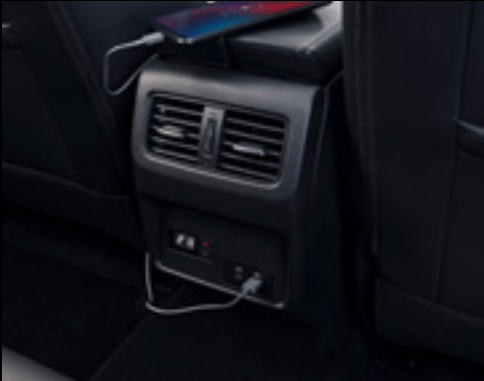
USB ports in the 2 nd row