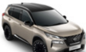
هيكل فضي شامبانيا سقف اسود Champagne Silver & Roof Black - XEW