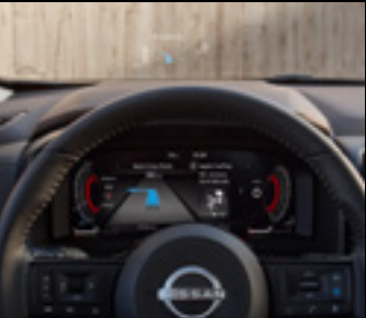
12.3" Fully digital meter 10.8" windscreen Head-up display