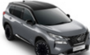
هيكل رصاصي سقف اسود Ceramic Grey & Roof Black - XEX

وتحرص نيسان على التأكد من أن عينات الألوان المعروضة هنا تعكس الألوان الفعلية للسيارة بأقرب درجة ممكنة. وقد يعزى الاختلاف الطفيف في عينات الألوان إلى عملية الطباعة، أو طريقة العرض سواء كانت في ضوء النهار أو الإضاءة الفلورية أو المتوهجة؛ لذا ننصحك برؤية الألوان الفعلية لدى وكيل البيع.