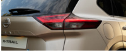
Rear Signature lamps