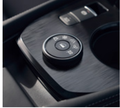
All-Wheel Drive mode switch

Playgrounds are not meant to have boundaries. Take on new terrains in confidence with Nissan's unique all-wheel drive technology, now available on X-Trail. e-4ORCE delivers the perfect balance between powerful and unprecedented control, with a smooth ride for all family thanks to superior handling on any surface. Tailor your drive even further with 5 selectable Drive Modes, including Normal, Sport, Eco, Off-road and Snow Mode for unmatched levels of comfort.