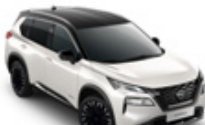
هيكل أبيض لؤلؤي سقف اسود Pearl White & Roof Black - XBJ