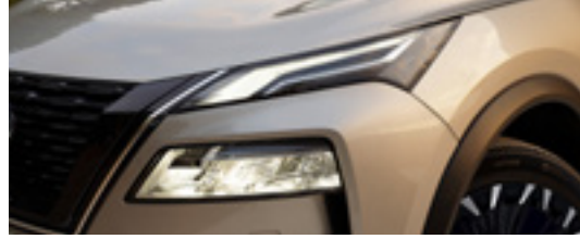
Front Signature lamps