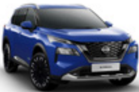
ازرق Blue - RBY