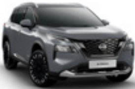
فضي Grey - KAD