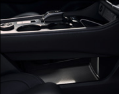
Floating centre console

Family adventures feel so comfortable with design details that make your journeys smoother. From rear-window sunshades that roll neatly away, to USB ports front and 2nd row to keep everyone's devices fully charged. When it comes to loading, enjoy up to 16 configurations with adaptable luggage boards and 60:40 sliding 2nd row to personalize your load space even further and ensure easy access to 3rd row.