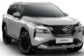
فضي Silver - K23