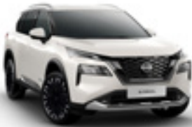
أبيض لؤلؤي Pearl White - QAB