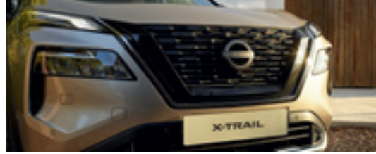
Strong front fascia