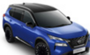
هيكل ازرق سقف اسود Blue & Roof Black - XEU