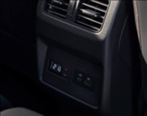
3-zone air conditioning