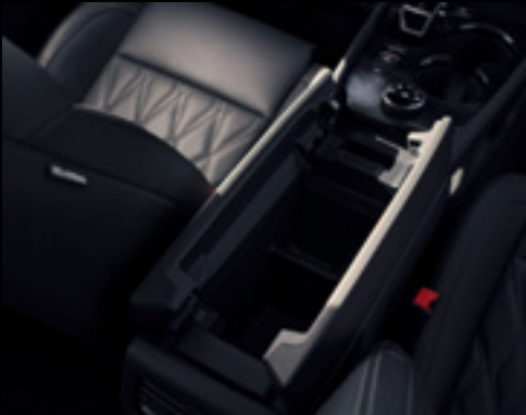
Butterfly opening central console