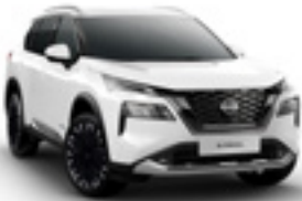
أبيض Solid White - QAK