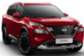
احمر Tinted Red - NBL