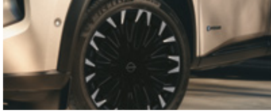
19" Alloy Wheels