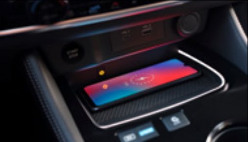
15W fast wireless charger

هل تتساءل أين تضع متعلقاتك؟ لا تفوت مساحة التخزين الموجودة أسفل الوحدة التحكم المركزية العائمة. داخل مقصورة أكس-تريل، كل شيء يتعلق بجودة التفاصيل – الجو المريح للإضاءة المحيطة، والشعور الناعم بالخامات الفخمة والسلاسة الملائمة للشحن اللاسلكي لهاتفك المحمول