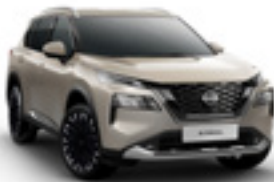
فضي شامبانيا Champagne Silver - KAY