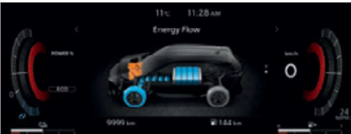
مقياس رقمي لتدفق الطاقة Digital combimeter with energy flow

With Nissan e-POWER, pioneering doesn't have to pause. e-POWER is a unique electrified technology composed of a fuel efficient petrol engine charging a battery. The battery then provides electricity to a motor driving the wheels. The result is a responsive and quiet driving sensation without the need to plug or recharge.