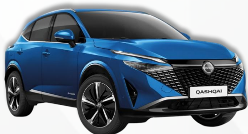
MAGNETIK PLAVA (RCF)