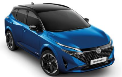
Modrá Magnetic a Čierna XGZ - 1000 €