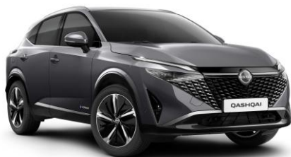
Sivá Gunmetal KAD - 0 €