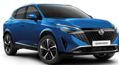
Modrá Magnetic RCF - 800 €