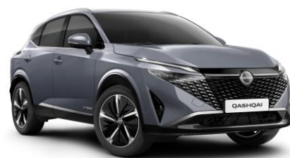
Sivá Ceramic KBY - 800 €