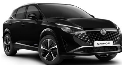
Čierna Pearl GAT - 600 €