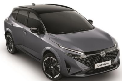
Sivá Ceramic a Čierna XEX - 1000 €