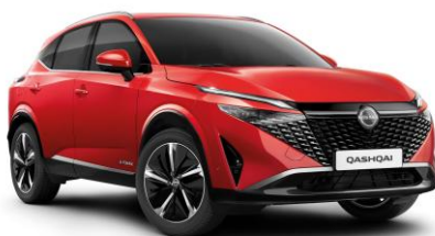
Červená Sunset NBV - 800 €