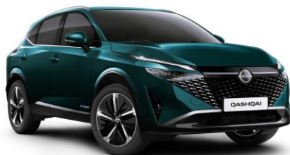
Zelenomodrá Ocean FAP - 800 €