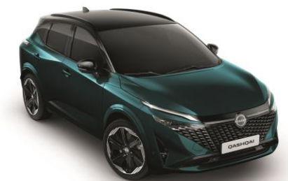
Zelenomodrá Ocean a Čierna YBJ - 1000 €