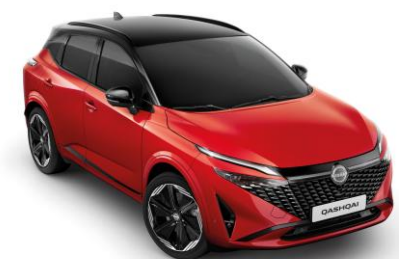
Červená Sunset a Čierna YAU - 1000 €