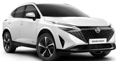
Biela Pearl QBE - 800 €