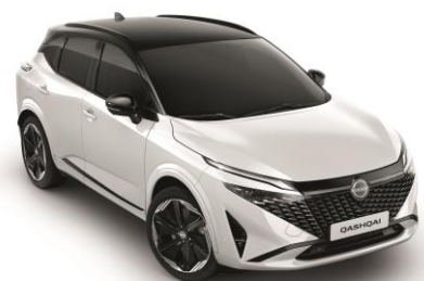
Biela Pearl a Čierna XKJ - 1000 €