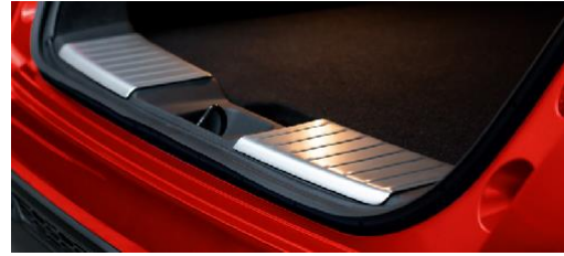
Bagaj Giriş Koruması