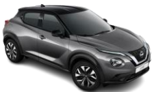
METALİK GRİ & SİYAH TAVAN - GAQ