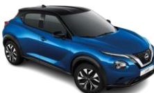
MANYETİK MAVİ & SİYAH TAVAN - XGZ