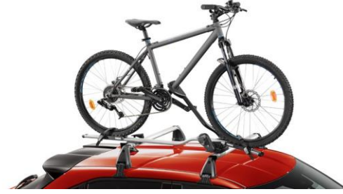
Tavan Bisiklet Taşıyıcı*