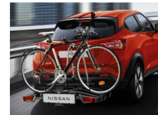
Çeki Demirine Monte Bisiklet Taşıyıcı*