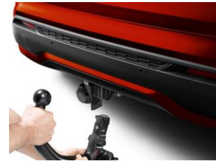
Sökülebilir Çekme Demiri *