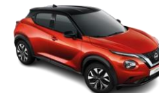
GÜN BATIMI KIRMIZISI & SİYAH TAVAN - YAU