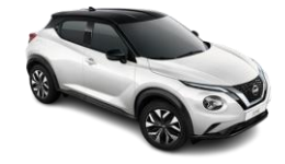
İNCİ BEYAZI & SİYAH TAVAN - XKJ