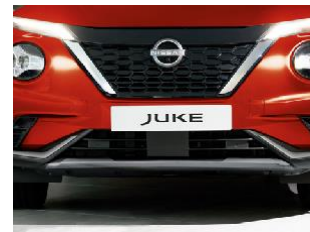
Ön Tamon Alt Çıtası