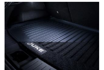
Çift Taraflı Bagaj Havuzu