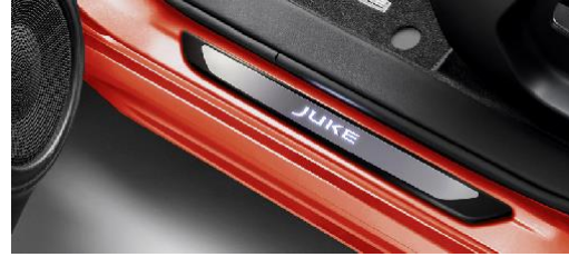
Aydınlatmalı Kapı Giriş Eşikleri