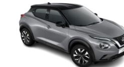
BULUT GRİ & SİYAH TAVAN - XEX