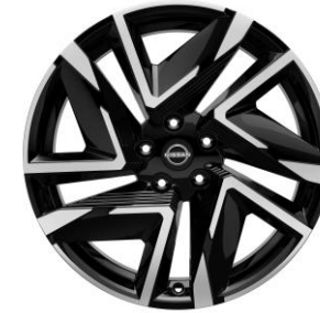
19" Alaőımlı N-Design Jantlar