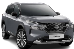
Сірий перламутр – KBY