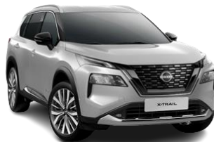
Сріблястий – K23