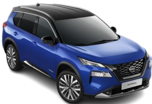
Синій металік з чорним дахом – XEU

Двоколірний кузов (основний колір – преміум/перламутр) – 55 880 грн