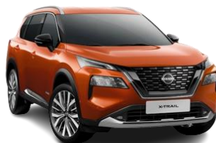
Помаранчевий – EBL