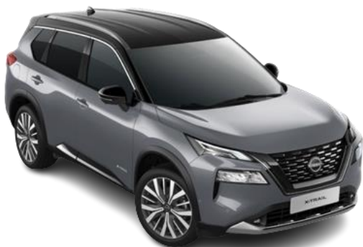
Сірий перламутр з чорним дахом – XEX

Двоколірний кузов (основний колір – преміум/перламутр) – 55 880 грн