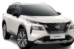
Білий перламутр – QAB