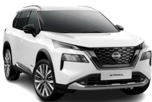
Білий – QAK