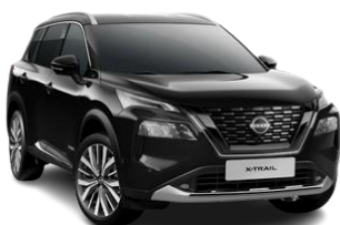
Чорний перламутр – G41