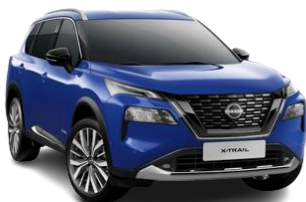
Синій – RBV