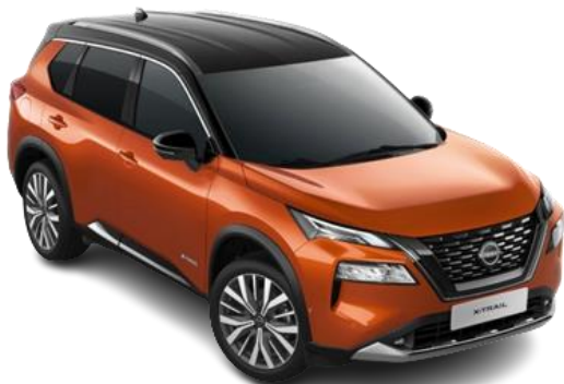
Помаранчевий металік з чорним дахом – XEV

Двоколірний кузов (основний колір – металік) – 47 520 грн