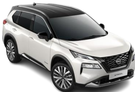
Білий перламутр з чорним дахом – XBJ