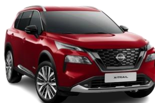
Червоний перламутр – NBL