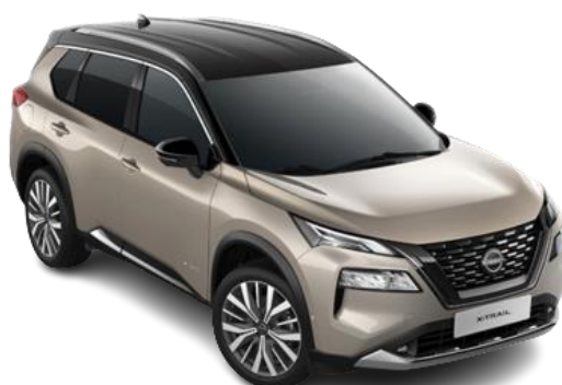
Срібло шампань з чорним дахом – XEW