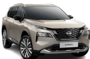
Срібло шампань – KAY