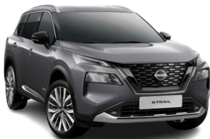
Темно-сірий – KAD